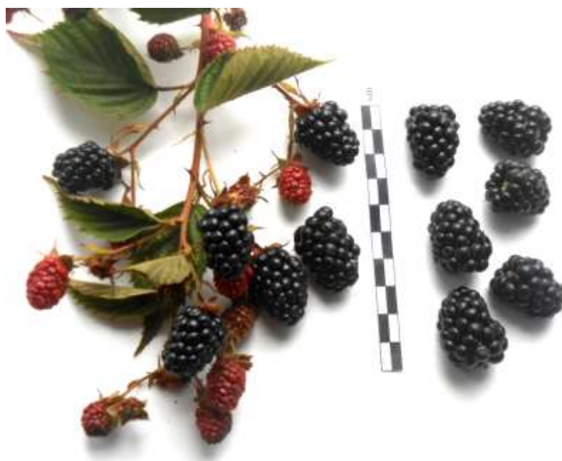
Рис. 3. Плоды сеянца сорта Cheyenne

верхней и средней частях побегов в небольшие кисти по 12-17 цветков, в идущих из нижней зоны побегов – до 40-50 цветков. Начало созревания относительно раннее. Имеет две, следующих одна за другой, волны цветения и созревания. В целом период созревания ягод длится около 2 месяцев (в среднем – 18.07-15.09). Ягоды черные, при созревании блестящие, массой около 4,5 г, отличного десертного, сладкого, с небольшой кислотой вкуса. Продуктивность, по данным биологического учета, 6,1 кг/куст. Самоплодность хорошая. Побегообразовательная способность умеренная, но регулярная. Зимостойкость выше средней. Зимние условия лет изучения форма перенесла под укрытием с минимальным подмерзанием или без него (0-2 балла). Однако в снежные зимы наблюдались разломы стеблей в местах разветвления под тяжестью снега. Форма устойчива к болезням и вредителям. Засухоустойчивость в условиях Орловской области хорошая. Побеги жесткие, шиповатые. Недостаток: шиповатость побегов.