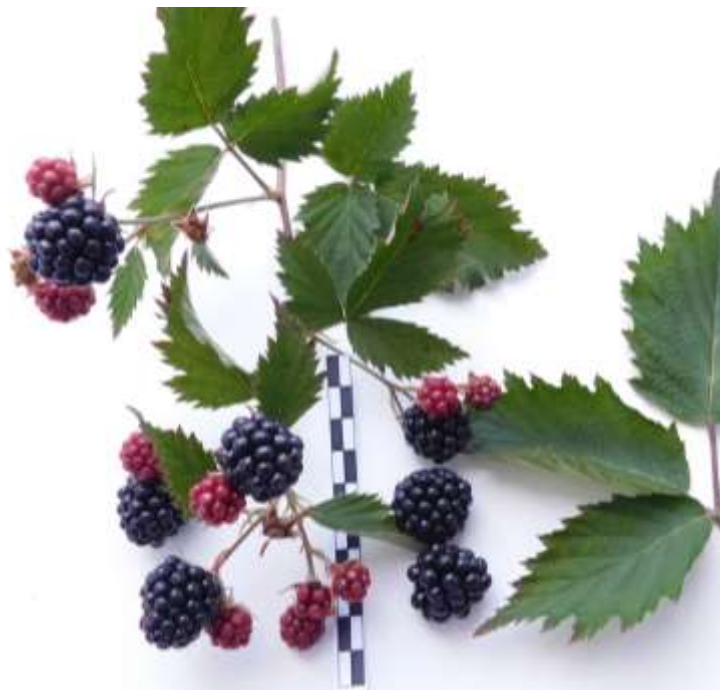
Рис. 5. Плоды сеянца сорта Loch Ness № 13

подмерзание составляло от 2,0 до 3,5 балла. Засухоустойчивость в условиях Орловской области хорошая. Побеги эластичные, бесшипные. Недостаток: умеренная зимостойкость.