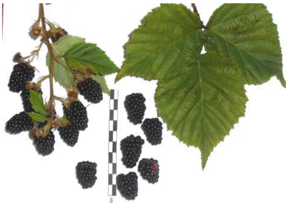
Рис. 1. Плоды и лист гибридной формы Thornfree × R. caucasicus I.

Отборная форма Thornfree × R. caucasicus I (рис. 1). Входит в морфологическую группу стелющейся ежевики, характеризующейся длинными побегами и затяжным ростом. Цветки белые, по 10-17 в соцветии. Срок созревания средний (23.07-15.08). Отличается высокой дружностью созревания, в связи с чем эта фенофаза заканчивается у нее с опережением или одновременно с ранними сортами. Ягоды черные, блестящие, средней массой 4,4 г. Вкус приятный, кисло-сладкий, слегка терпкий. Продуктивность, по данным биологического учета, 5,3 кг/куст. Самоплодность высокая. Обладает регулярной хорошей побегообразовательной и повышенной восстановительной способностью (при повреждении куста дает поросль от частей корневища). Зимние условия лет изучения под укрытием форма перенесла хорошо, с небольшими повреждениями (подмерзание до 1-3 баллов). Побеги эластичные, шиповатые. Недостаток: шиповатость побегов.