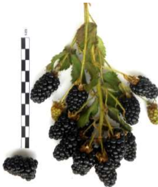
Рис. 2. Плоды сеянца сорта Black Satin

сивным и продолжительным ростом побегов, чем стелющиеся формы. Цветки белые, собраны в соцветия, содержащие от 10 до 50-60 (в соцветиях, идущих из нижней части стеблей) цветков. Начало созревания относительно раннее. Имеет две, следующих одна за другой, волны цветения и созревания. В целом период созревания ягод длится около 2 месяцев (20.07.-15.09). Ягоды черные, блестящие, отличного десертного вкуса, сладкие с небольшой кислотой, массой в среднем 4,7 г. Продуктивность, по данным биологического учета, 6,9 кг/куст. Самоплодность хорошая. Побегообразовательная способность умеренная. Побеги мощные, требуют обязательного ограничения верхушечного роста. Зимостойкость выше средней. Зимние условия лет изучения форма перенесла под укрытием с относительно небольшим подмерзанием или без него (от 0 до 3,5 балла). Устойчива к болезням и вредителям. Засухоустойчивость в условиях Орловской области хорошая. Побеги жесткие, шиповатые. Недостаток: шиповатость побегов.