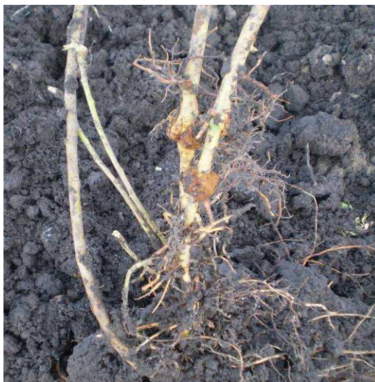
Рис. 2. Бактериальный корневой рак на подвое яблони

Бактерии корневого рака живут в почве [8], они проникают в растение только через механические повреждения корней (при прививке, окулировке, повреждении насекомыми, при обработке почвы) [7, 9]. При сильном развитии бактериоза, особенно при недостатке влаги, рост растений приостанавливается [10]. У пораженных растений довольно часто преждевременно желтеют листья. Наросты вызывают частичную закупорку проводящих сосудов, в связи с этим растения истощаются, постепенно усыхают и в конечном итоге погибают [9].