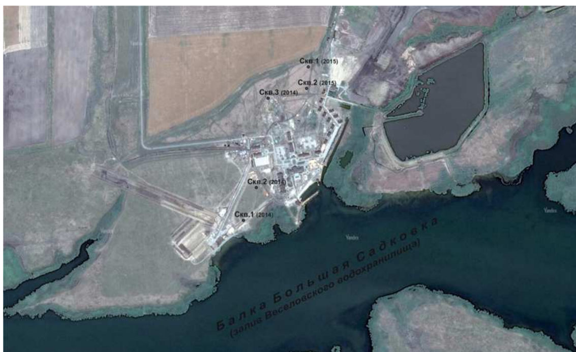
Рис. 1. Местоположение обследованного ключевого участка

Характеризуемая территория осмотрена при маршрутных проездах, изучены и проанализированы её космические снимки. Подробно обследован ключевой участок, типичный по большинству свойств для всей территории. Он расположен на берегу одного из заливов водохранилища, образованного балкой Большая Садковка (рис. 1).