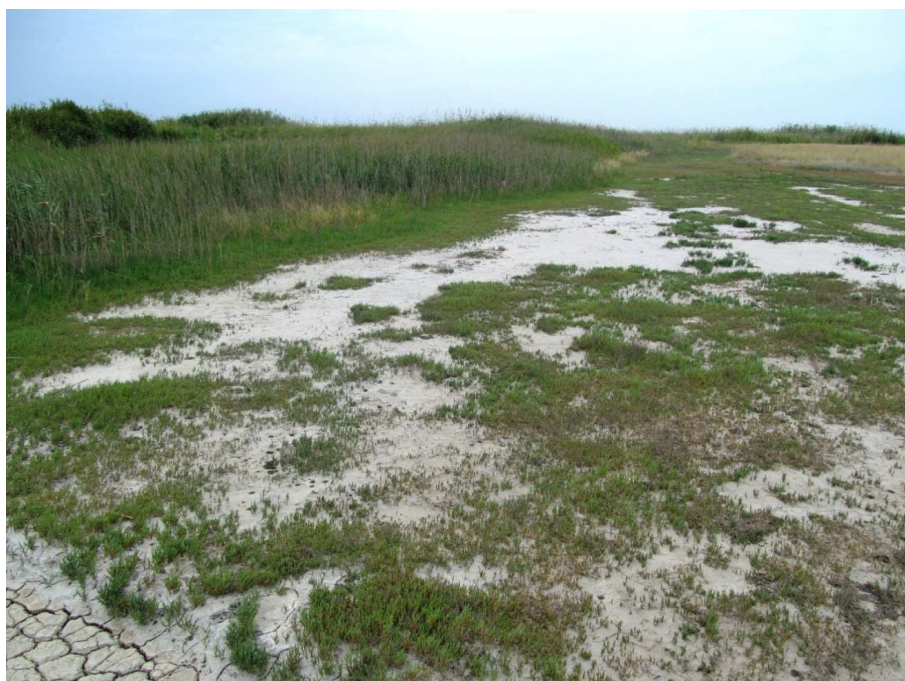
Рис. 2. Состояние растительности на берегах залива Большая Садковка.

Глубина грунтовых вод на обследованной территории тесно коррелирует с засоленностью почв и, в конечном счёте, является хорошим показателем пригодности почв для закладки виноградников. Но пользоваться этим показателем затруднительно. Более просто использовать превышение местности над уровнем воды в водохранилище, который определяет положение грунтовых вод. Уровни воды в водохранилище и грунтовых вод имеют непостоянные значения. Мы считаем, что лучше пользоваться средними их положениями. Изучение динамики колебания уровня воды в водохранилище [16] показало, что большую часть времени он колеблется между отметками 9,9 м и 10,5 м БС. Для анализа зависимости засоления почв от превышения места над уровнем воды в водохранилище нами взят средний уровень с отметкой равной 10,2 м БС.