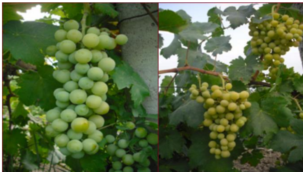
Рис.2. Технология повышения содержания сахаров в ягодах и ускорения сроков созревания винограда, сорт Ркацители