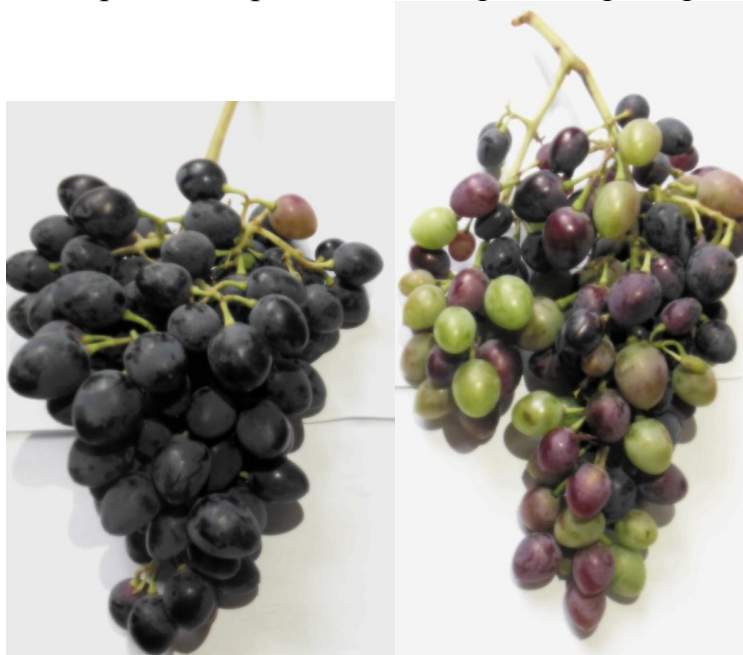
Рис.7. Технология повышения содержания сахаров в ягодах и ускорения сроков созревания винограда, сорт Заря Дербента