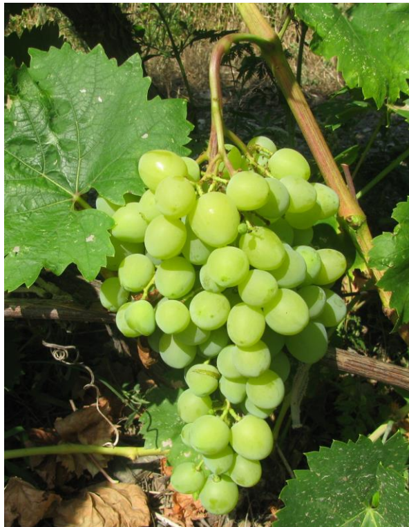
Рис.2. Гроздь сорта винограда Мускат Крыма

Тип цветка обоеполый. Гроздь очень большая, ветвистая, рыхлая (рис. 2).