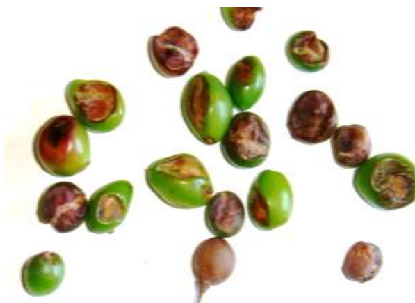
Рис. 1 Бактериоз ягод винограда с различной степенью развития

Бактериозом чаще всего поражаются ягоды на гроздях, расположенных с солнечной стороны. Симптомом поражения является вначале маленькое светло-жёлтое пятнышко, возникающее под кожицей ягоды. Вскоре на его месте образуется быстро увеличивающееся продольное углубление бурого или буровато-фиолетового цвета, вызванное некрозом, усыханием клеток ткани, расположенной между кожицей и сосудисто-волокнистым пучком (рис. 1).