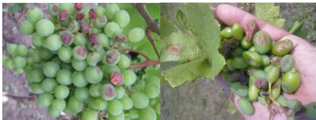
Рис. 2. Поражение ягод бактериозом у сортов Кунлеань и Баклановский

В 2018 году наблюдалось наиболее интенсивное развитие болезни. У сортов Баклановский, Лакхеди Мезеш до 35-50 % ягод в грозди были поражены бактериозом (рис. 2). До 25 % поражённых ягод отмечено у сортов Агат донской, Восторг, Кристалл, Платовский, Кунлеань. Не поражались бактериозом растения сортов Талисман, Магия.