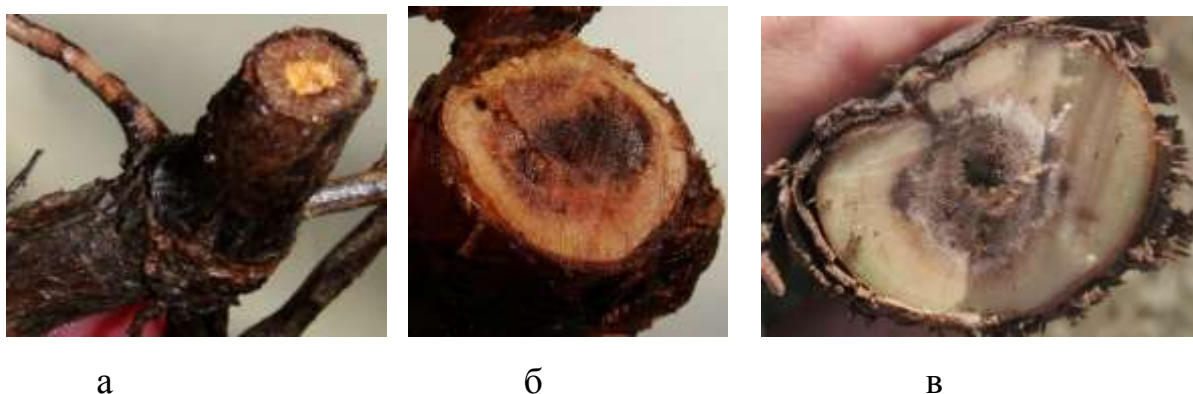
Рис. 4. Поперечный срез подземного штамба (а), надземного штамба (б), рукава (в) растений, поражённых бактериальным раком

У поражённых раком различных органов растений на поперечном срезе заметны участки некротических тканей (рис. 4).