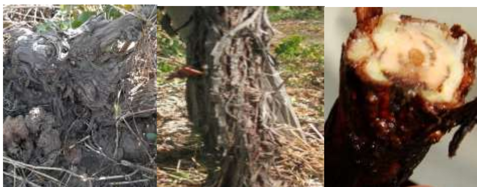
Рис. 3 Раковые опухоли на голове и штамбе кустов винограда

Опухоли, вызываемые бактерией Agrobacterium Vitis , могут формироваться на различных частях куста (рис. 3). Наросты опухолей, образующиеся на одревесневших частях куста, препятствуют сокодвижению и питанию растений, уменьшают их продуктивность, долговечность и устойчивость к неблагоприятным условиям среды. Разрастание раковой опухоли сопровождается большим притоком к ней пластических веществ, что приводит к постепенному истощению растения и его гибели. После появления опухолей в клетках заражённого растения нарушается метаболизм, и чем крупнее галлы, тем сильнее угнетение и более вероятна гибель куста.