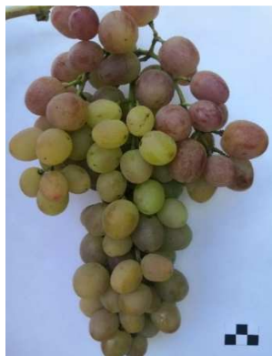
Рис.1. Созревающая гроздь винограда Ливия на подвое Orpenheim SO4

Полевой эксперимент реализован на виноградниках Краснодарского края (с. Красносельское) с капельным орошением. Плотность посадки – 1316 (3,8×2,0 м) растений винограда на одном гектаре.